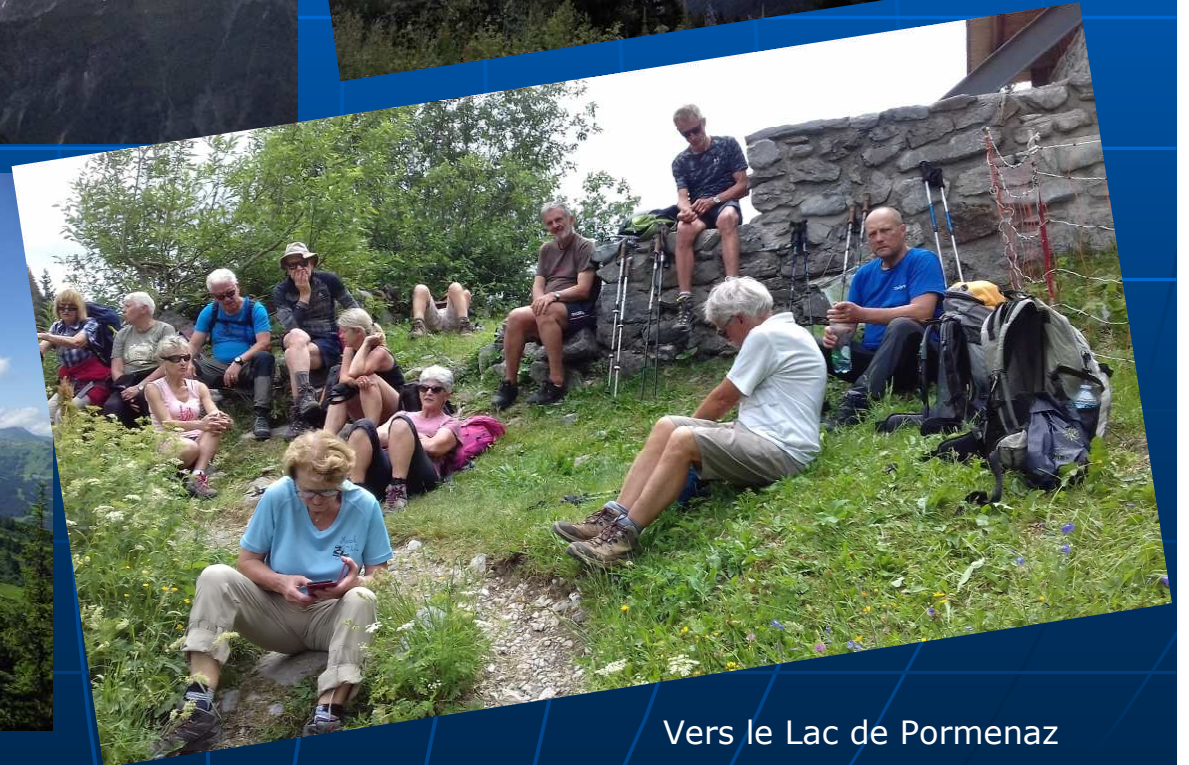
Vers le Lac de Pormenaz